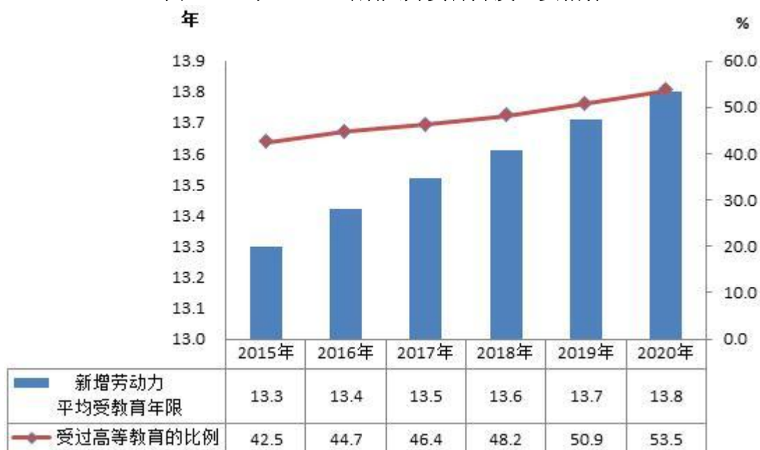
图 1 “十三五”时期人力资源开发主要指标

全国新增劳动力平均受教育年限 13.8 年，比上年提高 0.1 年，其中，受过高等教育比例达到 53.5%，比上年提高 2.6 个百分点。