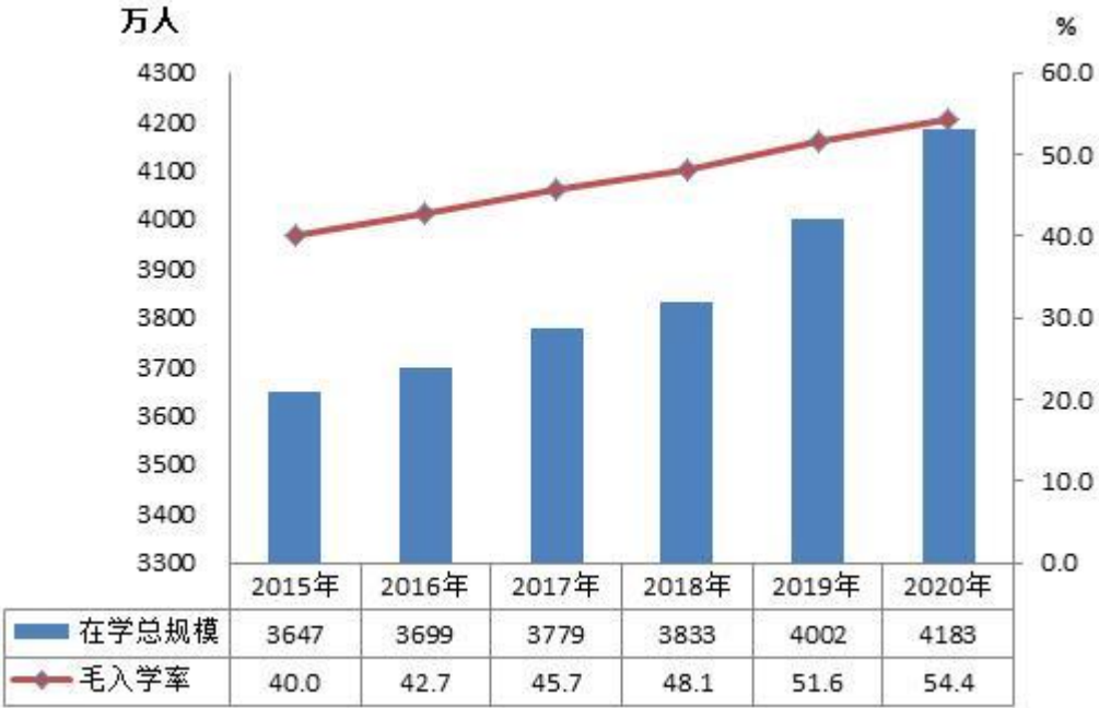
图 5 “十三五”时期高等教育在学总规模和毛入学率

研究生招生 [20] 110.66 万人，比上年增加 19.00 万人，增长 20.74%。其中，博士生 11.60 万人，硕士生 99.05 万人。在学研究生 313.96 万人，比上年增加 27.59 万人，增长 9.63%。其中，博士生 46.65 万人，在学硕士生 267.30 万人。毕业研究生 72.86 万人，其中，毕业博士生 6.62 万人，毕业硕士生 66.25 万人。